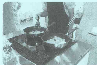
▲鮭の切身を 焼いています。