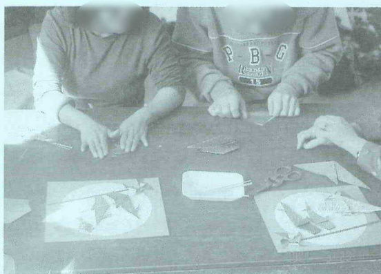
H15.3.23 こいのぼりをつくろう！