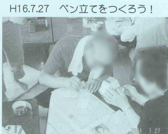
H16.7.27 ペン立てをつくろう！

むずかしそで やっているうちに ボランティアの人に あしえてもらいホッ と、かんたんでした